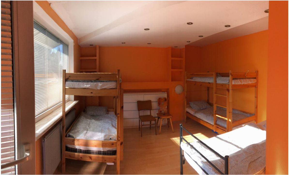
Pokój 4 ( góra )