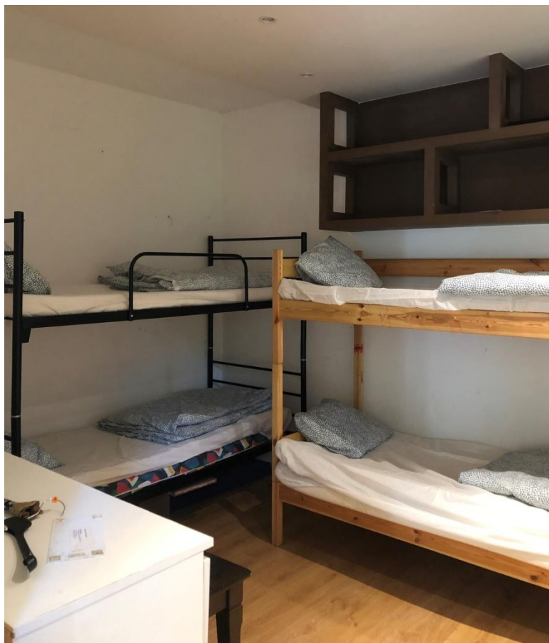
Pokój 2 (górze)